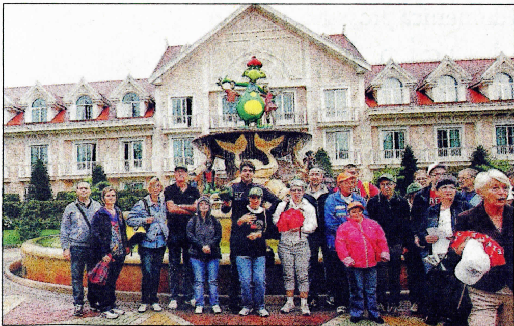
I ragazzi della Volanda in gita. Hanno beneficiato dell'iniziativa del Rotary